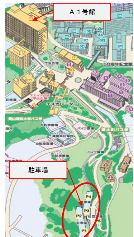
岡山理科大学の見取り図

TEL: 086-256-8412 e-mail: jshiraga@office.ous.ac.jp