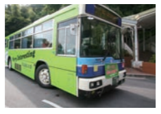
R 岡山理科大学バス停