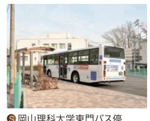
S 岡山理科大学東門バス停

加計学園創立50周年を機に建てられた記念館。創立者や歴史を紹介するギャラリー、スカイラウンジ、約150名が収容できる多目的のホールなどを設置。