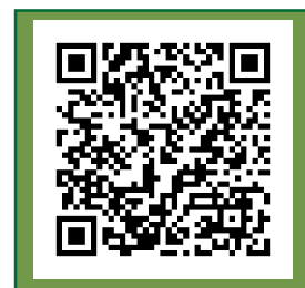
▲州立ライト大学 短期海外研修申込 2023(Google Form)