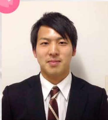
学生委員会委員長