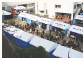
学友会へのテント・ベンチ等の寄贈