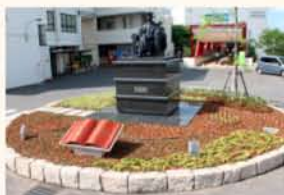
理大正門前（ロータリー周辺植栽）