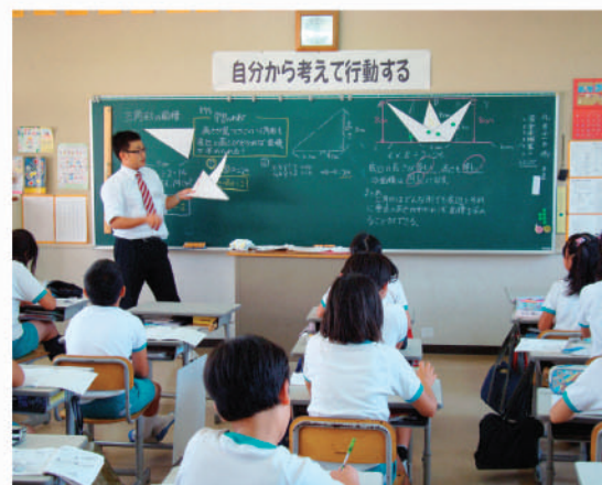
小学校での実習風景

*在学中に、聖徳大学通信教育部(千葉県松戸市)の通信教育とスクーリングを利用し、免許取得に必要な単位数を修得をめざします。(定員20名)